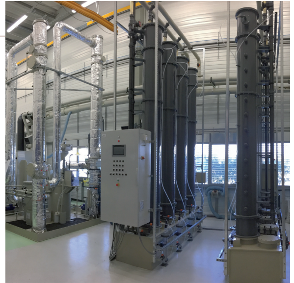
Atelier, hall pilote et laboratoire en Alsace, France

Expert en dépollution de l'air et en traitement des odeurs depuis plus de quatre décennies, John Cockerill conçoit, développe et met en service des solutions innovantes et sur mesure, adaptées aux besoins spécifiques de chaque client. Notre gamme complète de produits Ayra™ va de l'élimination des odeurs (pollution olfactive) et de la dépollution des gaz (pollution chimique) à la ventilation industrielle, en passant par la récupération de l'énergie contenue dans le flux de déchets traité ou de l'ammoniac utilisé comme engrais minéral.