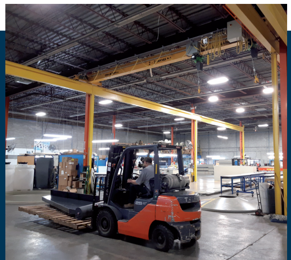
Atelier au Québec, Canada

Récupération d'énergie à partir des émissions de gaz